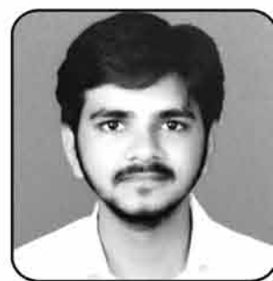
શ્રેણીક મનિષ કરશન નિસર અંધેરી-આઘોઈ (C.A.)