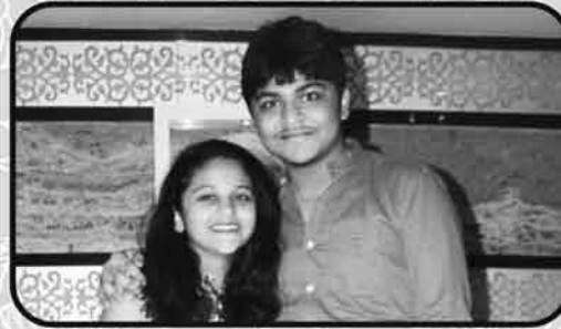
ધુમીલ અને દ્રષ્ટી મેહુલ સત્રા