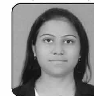
જુનલ ઉગમશી ખેરાજ નંદુ સામખીચારી L.L.B.