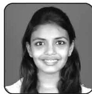
કૃપા હસમુખ વિજપાર બોઆ ગોરેગામ-નુ. ત્રંબો (C.A.)